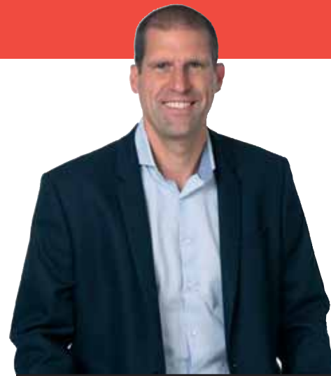
Door Stijn Boeykens